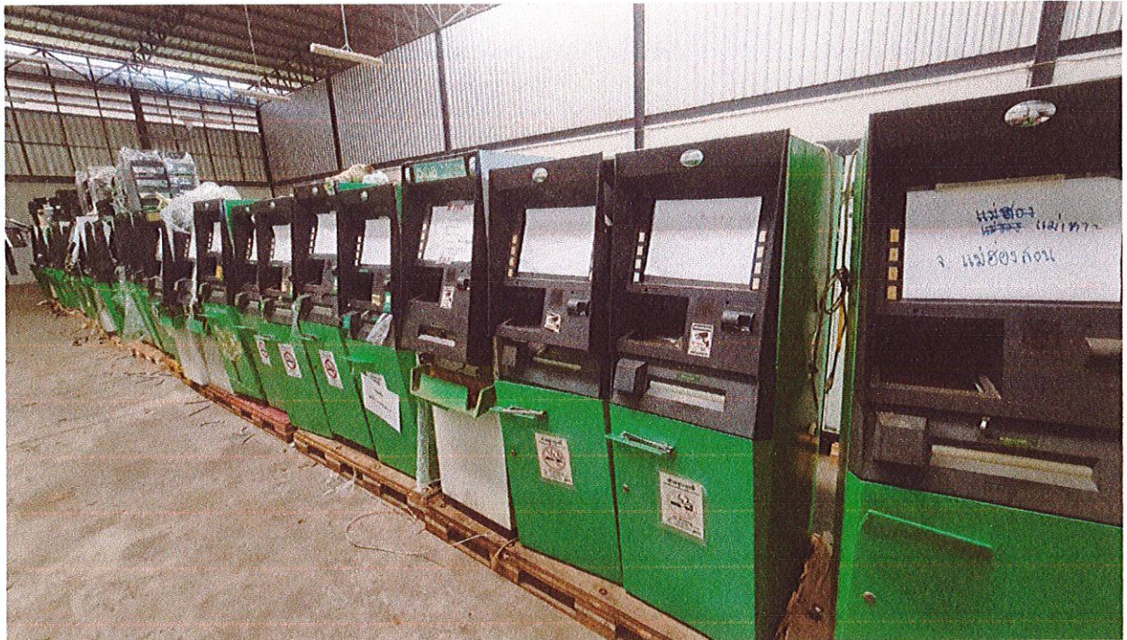
รูปถ่ายทรัพย์สินขายทอดตลาด (ATM) (บางส่วน)